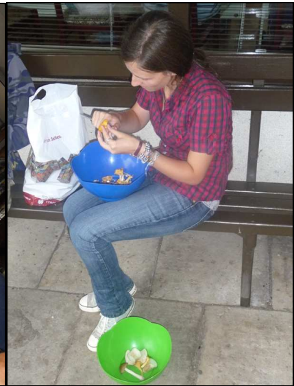
Eksperimentai su grybais.

Stovykloje paskaitas skaitė Lietuvos bei užsienio aukštosiose mokyklose studijuojantys doktorantai, aktyviai mokslinį darbą dirbantys ir tarptautiniu mastu pripažinti mokslininkai. Lektoriai pristatė savo tyrimus bei supažindino moksleivius su savo mokslo sritimis. Paskaitose vasaros mokyklos dalyviams pasakota apie daugeliui rūpimą mokslo darbų kaip intelektualės nuosavybės apsaugą, lyderystės pamatus, naujus radiolokacijos taikymus, smegenotyra, zebražuvės panaudojimą Parkinsono ligos tyrimuose, naujų vaistų kūrimą ir jų toksiškumo tyrimus, vitamino C funkcijas ir jo poveikį žmogaus organizmui, branduolinę fiziką, vertybių kovą Lietuvos politikoje ir kt.