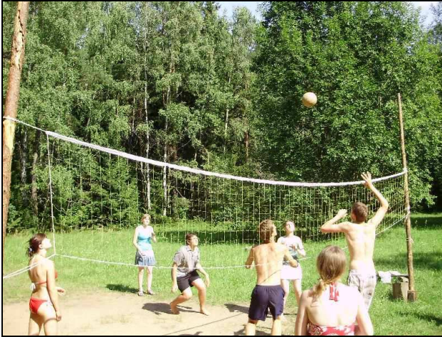
Aktyvus poilsis tinklinio aikštelėje.