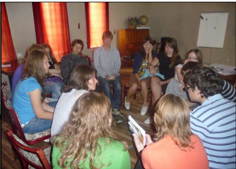
Įdomi lektorės ir moksleivių diskusija po paskaitos.

Vasaros mokyklos organizatoriai tradiciškai organizavo ekskursijas į mokslo institutus. Moksleiviai apsilankė Fizikos institute, Biotechnologijos institute ir VU Onkologijos instituto mokslinių tyrimų centre, kur susipažino su mokslo žinių taikymo pavyzdžiais, naujausiais mokslo pasiekimais ir mokslinio darbo Lietuvoje galimybėmis.