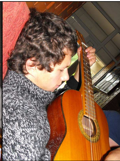
Dainos, pritariant gitarai.