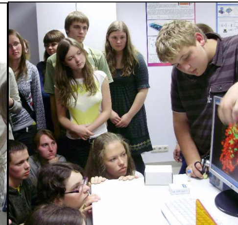
VU Onkologijos instituto mokslinių tyrimų centre.