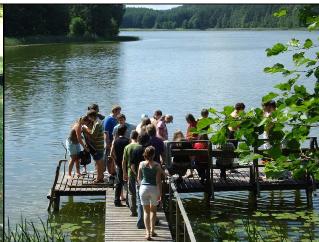
Ir štai – jau nuostabios gamtos apsuptyje.

Kiekvieną dieną „Vasaros mokyklos“ dalyviai klausėsi patyrusių mokslininkų paskaitų, lavino kūrybinį mąstymą, nuostabios gamtos apsuptyje varžėsi žaisdami tinklinį, diskutavo apie mokslinius tyrimus.