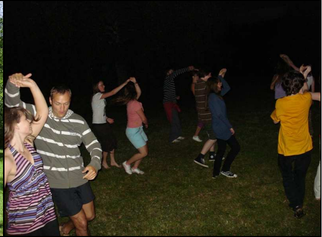
Smagūs lietuvių liaudies šokiai.