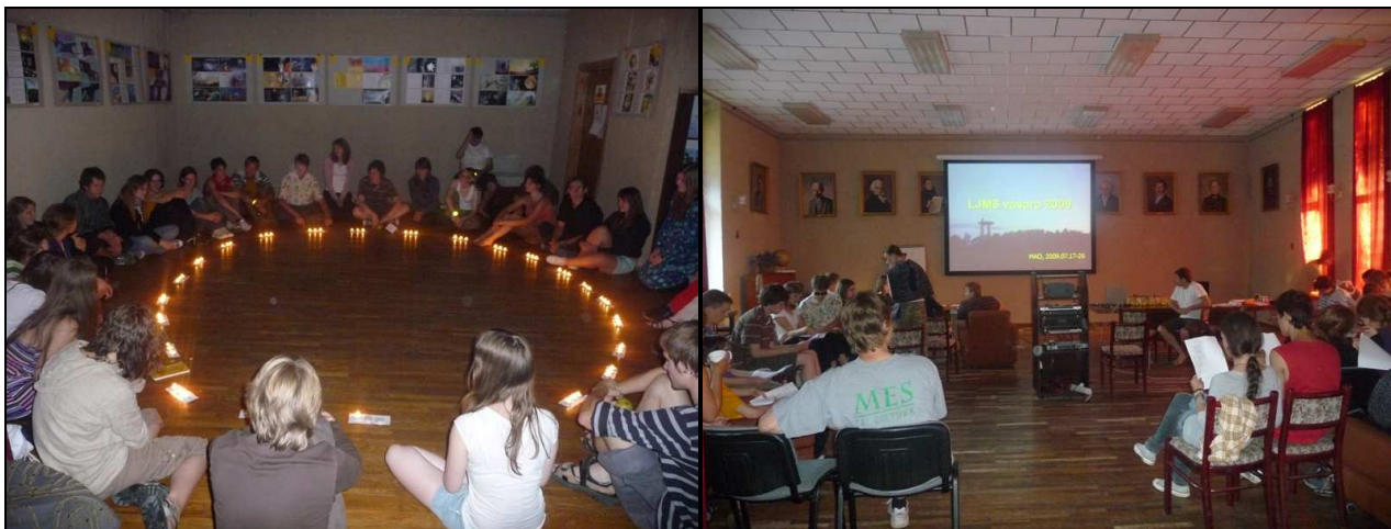
Slaptų draugų prisipažinimas, padėkos, žaismingos nominacijos ir stovyklos aptarimas.

Mokyklos dalyviai pabrėžė, kad stovykla buvo naudinga ir džiaugėsi, kad nagrinėti klausimai ir diskusijos plėtė daugelio akiratį, paskatino labiau domėtis moksliniais tyrimais, o užmegzti kontaktai su kitais moksleiviais ir vyresniais kolegomis, pasak jų, tikrai bus naudingi ateityje.