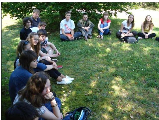
Prieš išvykstant į „Vasaros mokyklą“.

LJMS į vasaros mokyklą pakvietė beveik trisdešimt mokslui neabejingų moksleivių – olimpiadų, konkursų dalyvių – iš įvairių Lietuvos regionų. Nemažai vasaros stovyklos dalyvių savarankiškai ar su vyresnių mokslininkų pagalba atlieka mokslinius tyrimus. Moksleivių atranka buvo vykdyta bendradarbiaujant su Nacionaline moksleivių akademija, kuri rekomendavo net dešimt vasaros stovyklos dalyvių.